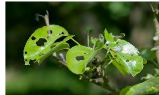
omizi defoliatoare- atac

MAVRIK 2 F (EVURE) - 0,05 % (0,75 l/ha) - omologat pentru combaterea afidelor și păduchelui lănos sau