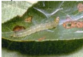
molia pielitei fructelor